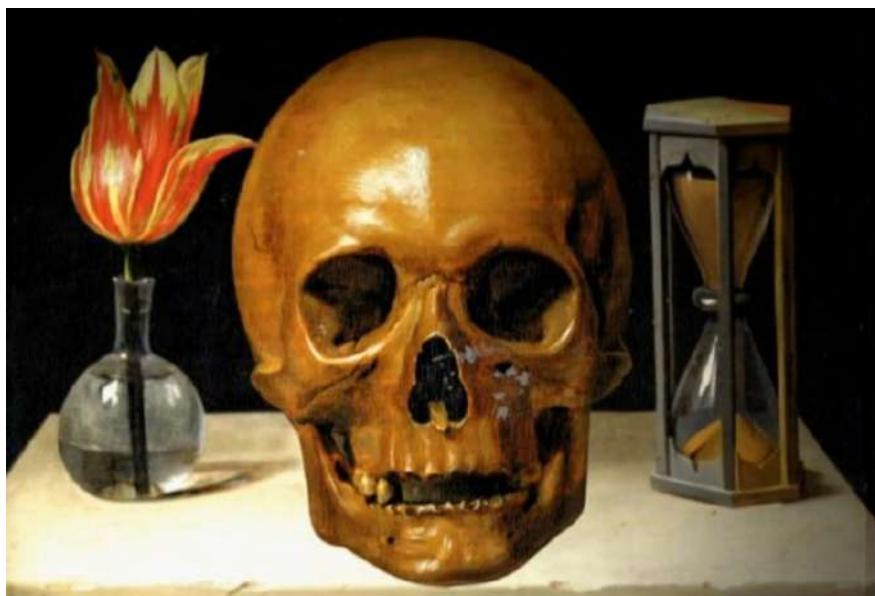
Vanité - Philippe de Champaigne

Notre recherche portera sur la compréhension des causes de cette difficulté à faire face et à embrasser le vide afin de pouvoir y apporter une réponse en acupuncture.