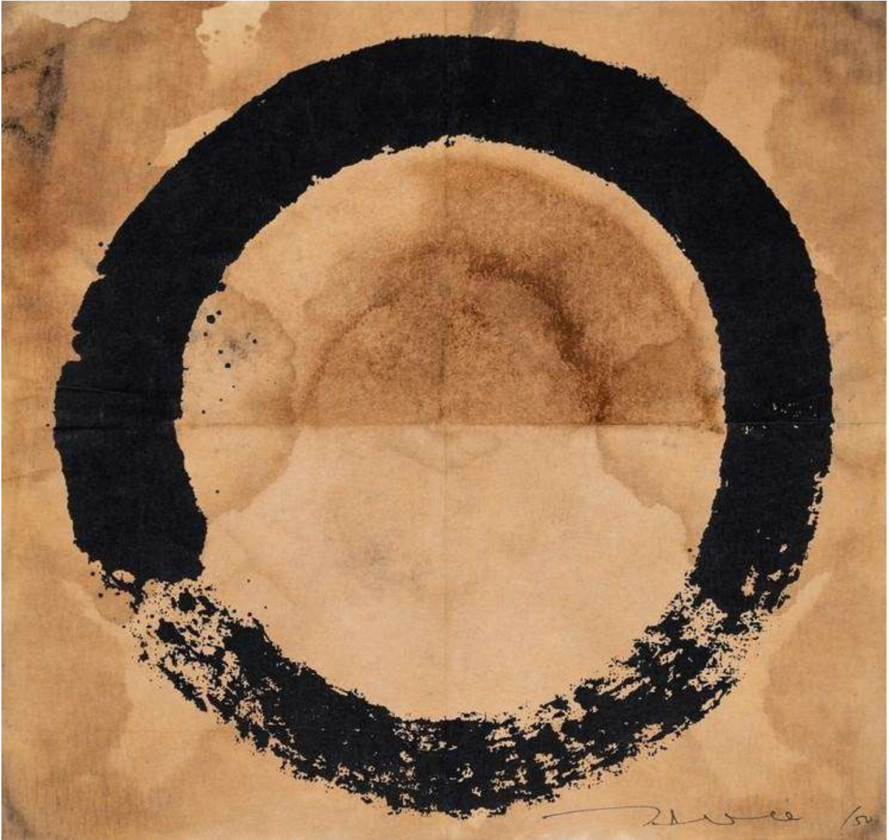
Takashi Murakami, Coffee Enso Black, 2020